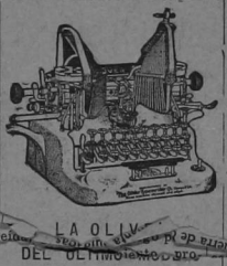
LA OLIVER DEL ÚLTIMO TIPO

Trece americanos han sido arrestados en Metlayuca, Estado de Puebla. El Consol inglés en Tuxpan trata de obtener su libertad.